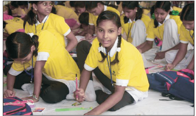
बैंक द्वारा गोद ली गई बालिकाओं के लिए कार्यक्रम