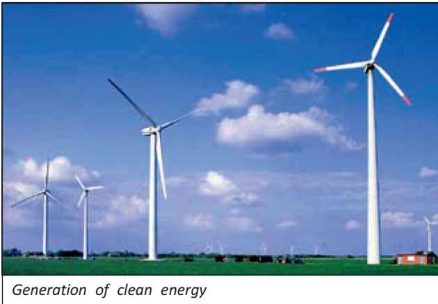
Generation of clean energy