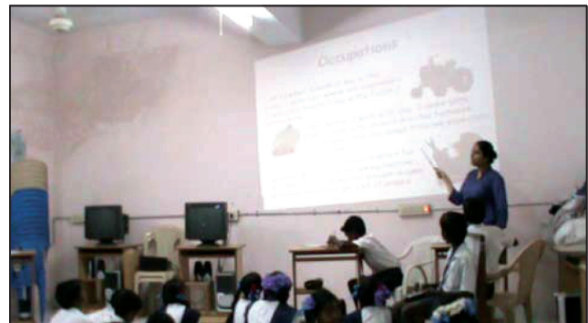
SBI Youth for India Fellow conducts English classes for village children at Keezh Agraharam, Tamil Nadu.