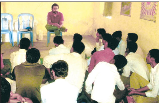
एसबीआई यूथ फार इंडिया फेलो द्वारा सावद गांव, महाराष्ट्र में आयोजित युवा मार्गदर्शन कार्यक्रम.

बैंक अपने अनुसंधान और विकास कोष से बड़े पैमाने पर अपनी गतिविधियों से जुड़े अनुसंधान कार्य में सहायता प्रदान करता है। बैंक ने भारतीय रिज़र्व बैंक के साथ मिलकर 100,000 ग्रेट ब्रिटेन पाउंड का