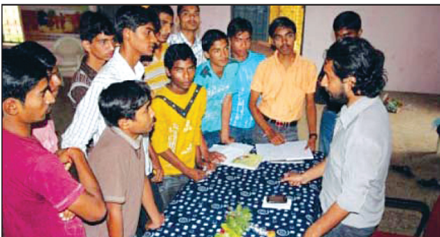
SBI Youth for India Fellow conducts career guidance programme at Risod village, Maharashtra.