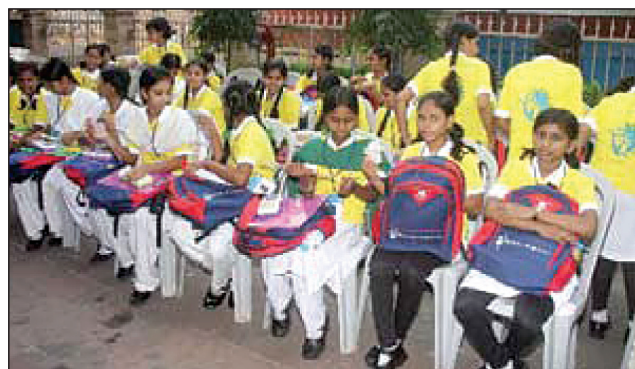
Girl Children adopted by SBI