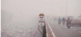
On Sunday, the Delhi government announced that primary schools would remain shut till November 10

Under Stage IV of Grap, only compressed natural gas, electric, and BS VI-compliant vehicles from other states are allowed to enter Delhi, with exemptions granted to those involved in essential services. All medium and heavy goods