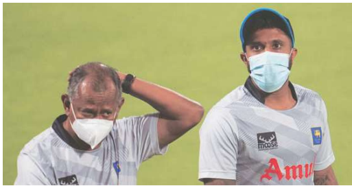
Sri Lanka captain Kusal Mendis (right) during a practice session in Delhi

The International Cricket Council (ICC), the game's governing body, is closely monitoring the situation, and said it will take a call on Monday, when match officials assess the air quality.